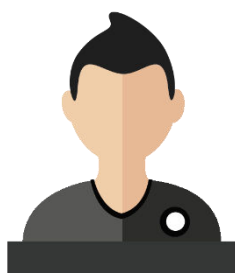
HAIMER Lotfi Éducateur Collège - Lycée