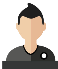
CASTELLI Fabio Éducateur Collège